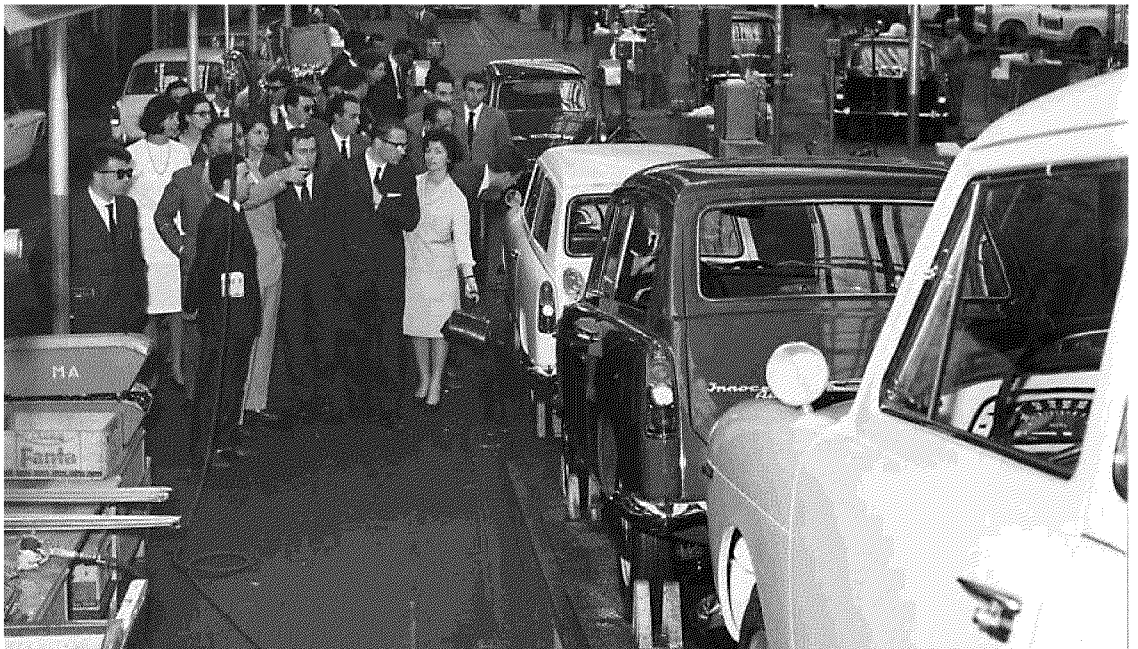
I giovani imprenditori vicentini nello stabilimento della Innocenti. Siamo nel 1964