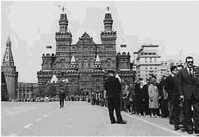
La prima missione importante: a Mosca durante la Guerra Fredda