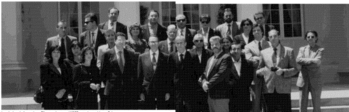
La missione in Argentina e Cile organizzata nel 1995 sotto la presidenza Calearo